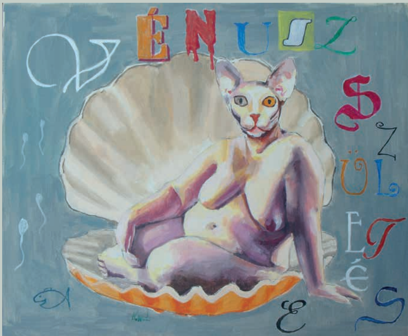
KOVÁCS Béla: Vénusz születése