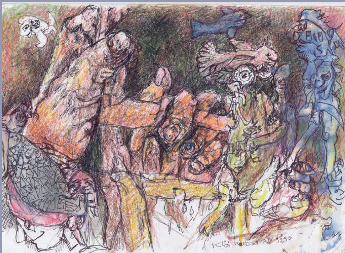
Dvorcsák Gábor: A szülői házban. A.D. 3250