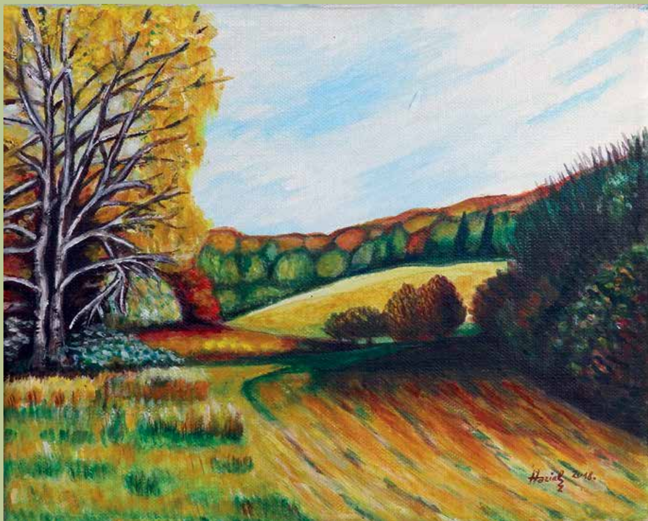
Haziél: Őszi tájkép